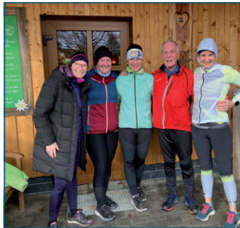
Silvesterlauf in Bad Marienberg