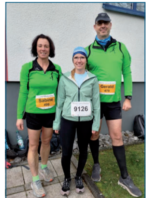
Silvesterlauf in Montabaur